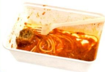
שאריות ארוחת צהריים