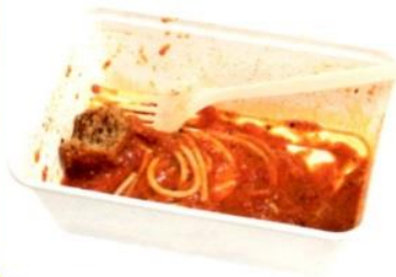
שאריות ארוחת צהריים