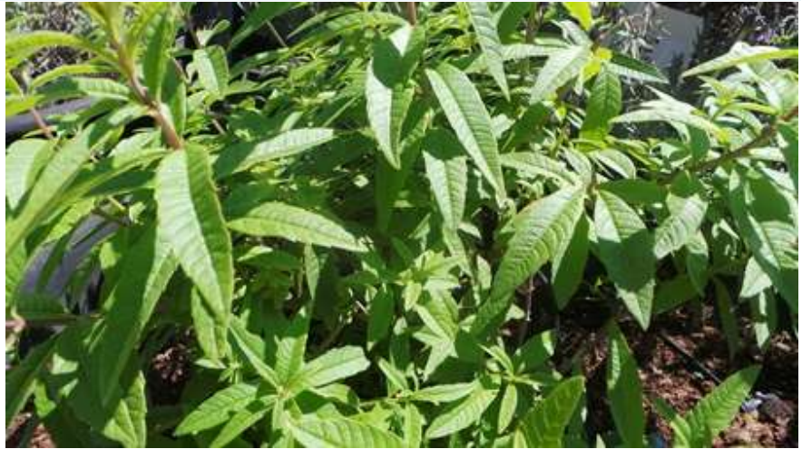
לואיזה Alousia -