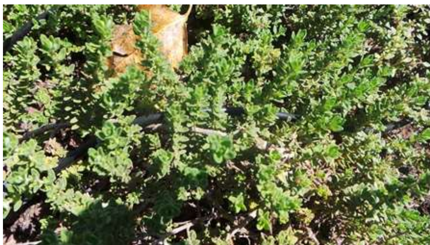
- בת קורנית פשוטה Thymus vulgaris