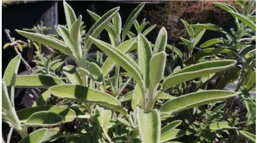
מרווה רפואית salva officinalis -