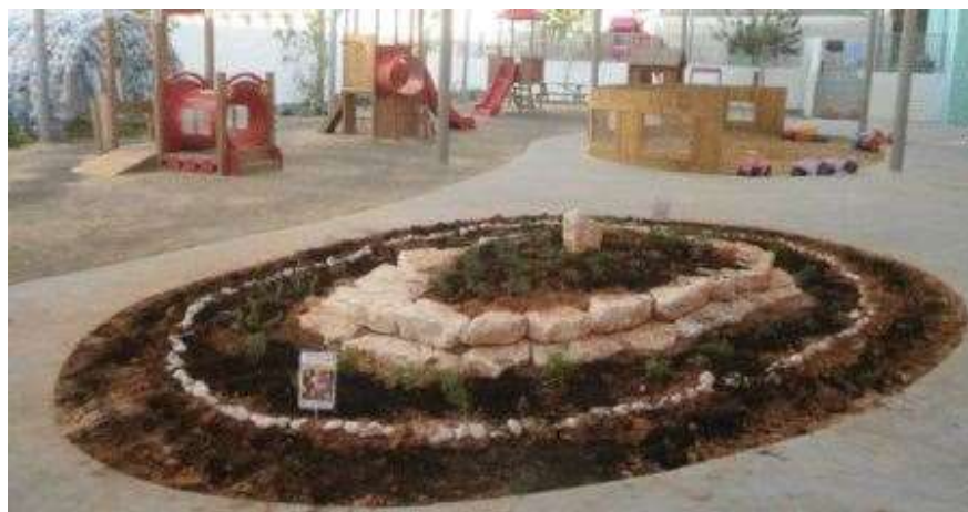
אשכול גנים לב, תל-אביב

משרד החינוך המינהל הפדגוגי אגף א' לחינוך קדם יסודי