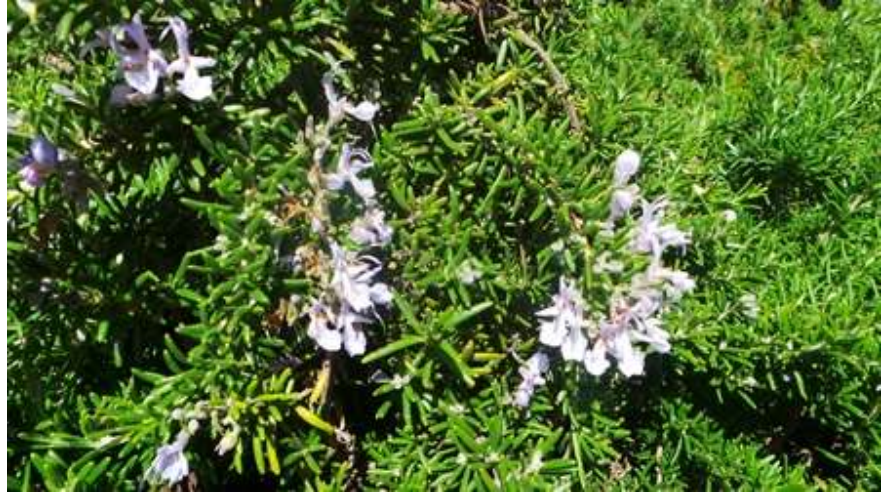
רוזמרין Rosmarinus officinalis -

משרד החינוך המינהל הפדגוגי אגף א' לחינוך קדם יסודי