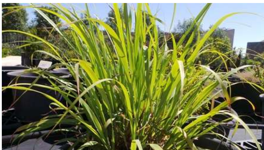
- Cymbopogon citratus לימונית