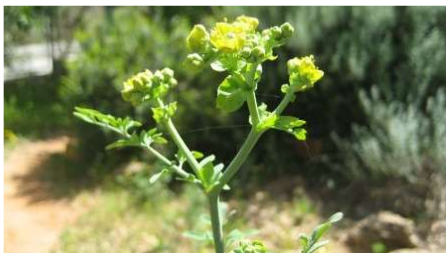
פיגם מצוי Ruta chalepensis -