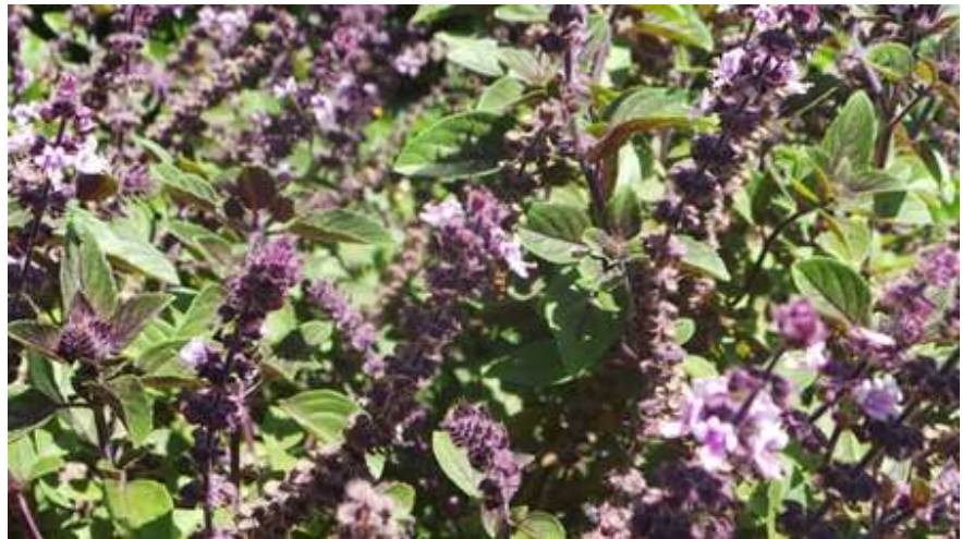
ריחן Basilica -