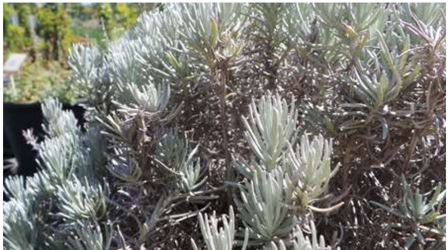
לבנדר Lavendula -