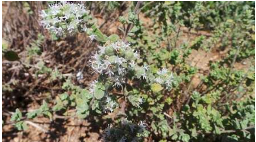
אזוב מצוי majorana syriaca -