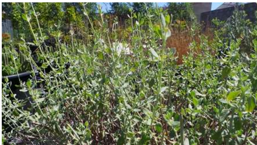
– זוטה לבנה Micromeria fruticosa

משרד החינוך המינהל הפדגוגי אגף א' לחינוך קדם יסודי