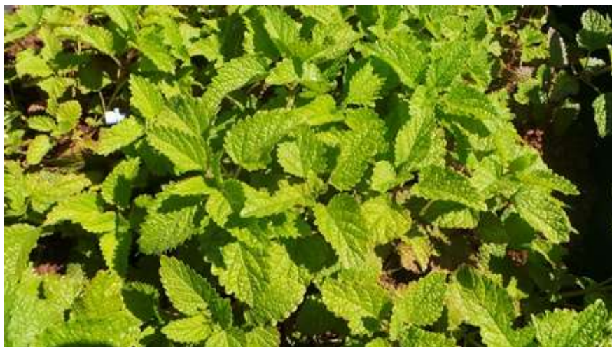
- Melissa officinalis מליסה

משרד החינוך המינהל הפדגוגי אגף א' לחינוך קדם יסודי