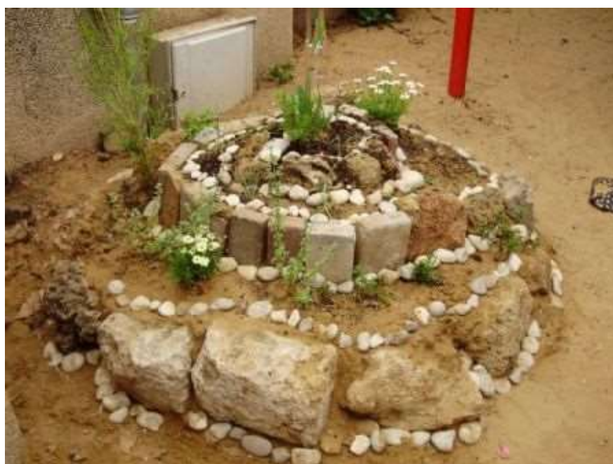
גן צפרירים, תל-אביב